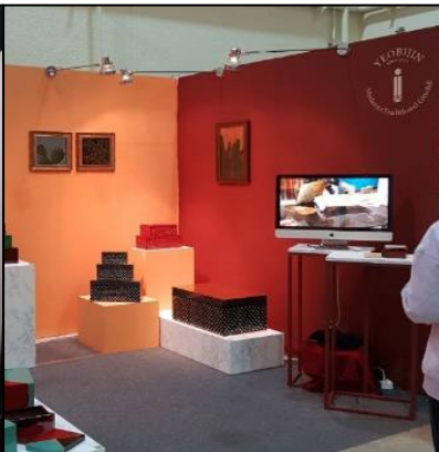
▲ 페인트 벽체 활용