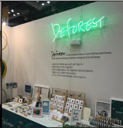
▲ 네온사인 활용