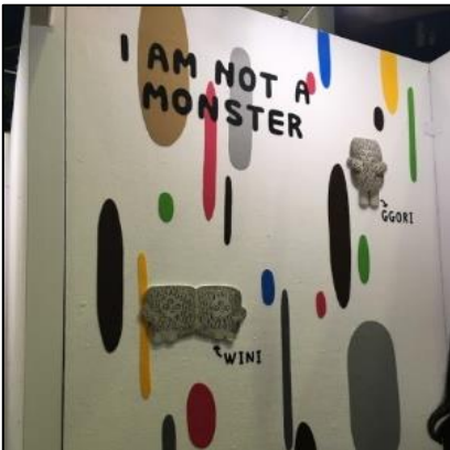
▲ 시트지/부분시트지 활용