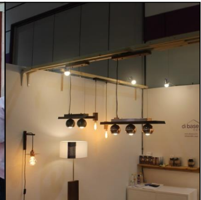
▲ 조명 활용