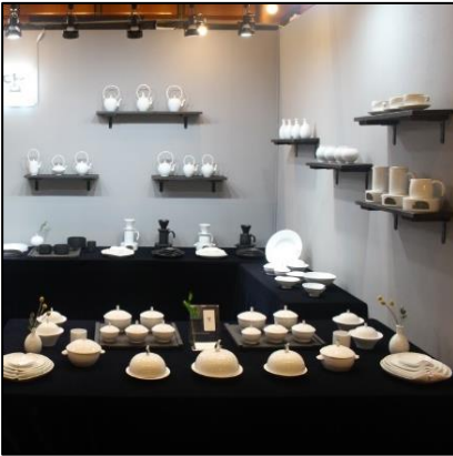
▲ 테이블보 활용