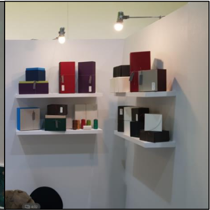
▲ 선반 활용